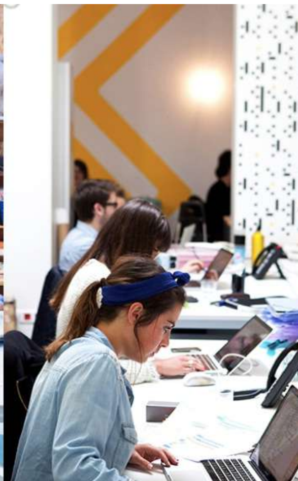
Créatis Coworking, incubateur