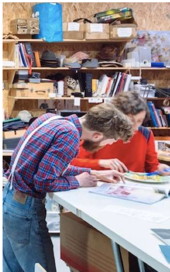
MAKE ICI Fablab